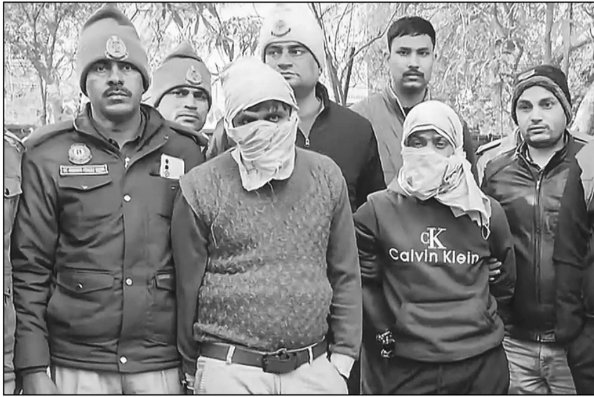
Police personnel arrest two wanted criminals following a brief exchange of fire, at RK Puram area, in New Delhi.